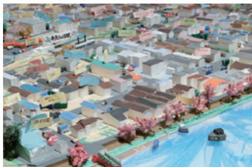
南気仙沼駅周辺【宮城県気仙沼市】