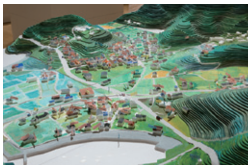
唐桑・大沢【宮城県気仙沼市】