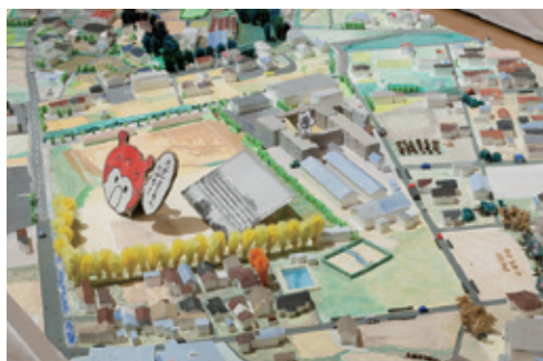
階上・岩井崎【宮城県気仙沼市】