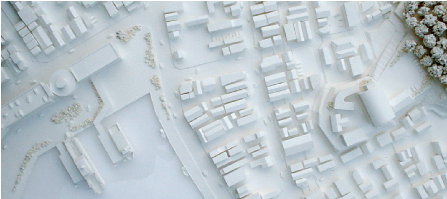
魚町【宮城県気仙沼市】